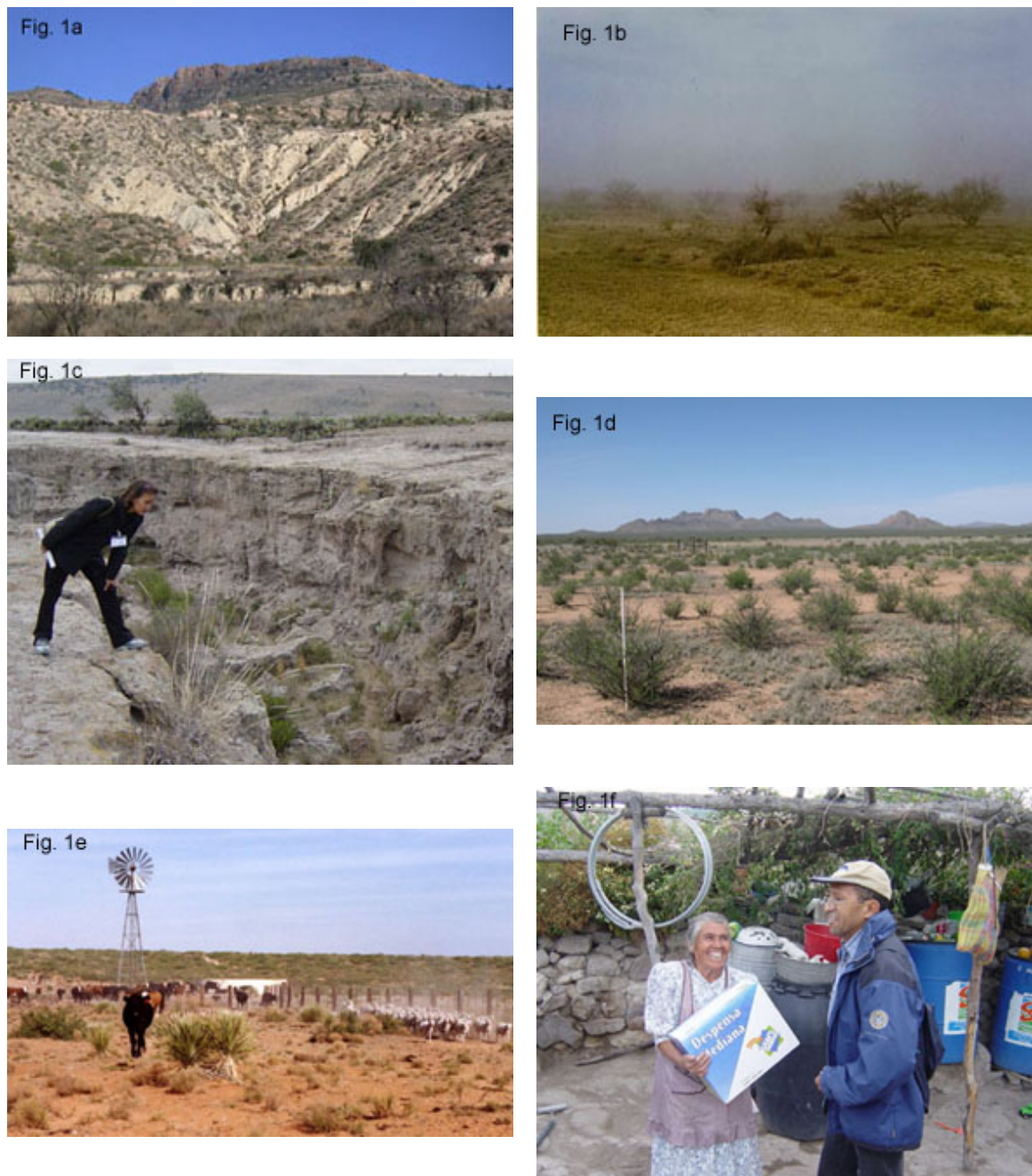
Figura 1. Distintos aspectos de la desertificación en zonas áridas y semiáridas. (a) Erosión hídrica en un espartal de Stipa tenacissima en Petrel (Alicante), (b) Erosión eólica en Argentina, (c) Erosión hídrica en la comunidad de La Amapola (San Luis Potosí, México), (d) Formación arbustiva en una zona tradicionalmente ocupada por especies herbáceas en la Estación Experimental de Jornada (Nuevo México, Estados Unidos), (e) Sobrepastoreo por ganado vacuno en la Estación Experimental de Jornada y (f) Los habitantes de zonas desertificadas a menudo dependen de ayuda externa para poder subsistir; reparto de ayuda humanitaria a los habitantes de la comunidad de La Amapola.

sobrepasados, la resiliencia social y los subsidios de los gobiernos pueden no ser suficientes para compensar la pérdida de productividad de la tierra, y ello genera toda una batería de cambios socioeconómicos que van desde pequeños cambios en la actividad comercial hasta grandes movimientos migratorios (Fernández et al. , 2002).