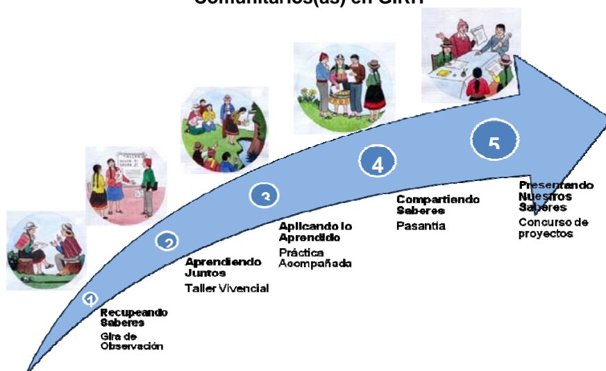
Gráfico 1: Proceso metodológico del Programa de Formación de Líderes(as) Comunitarios(as) en GIRH