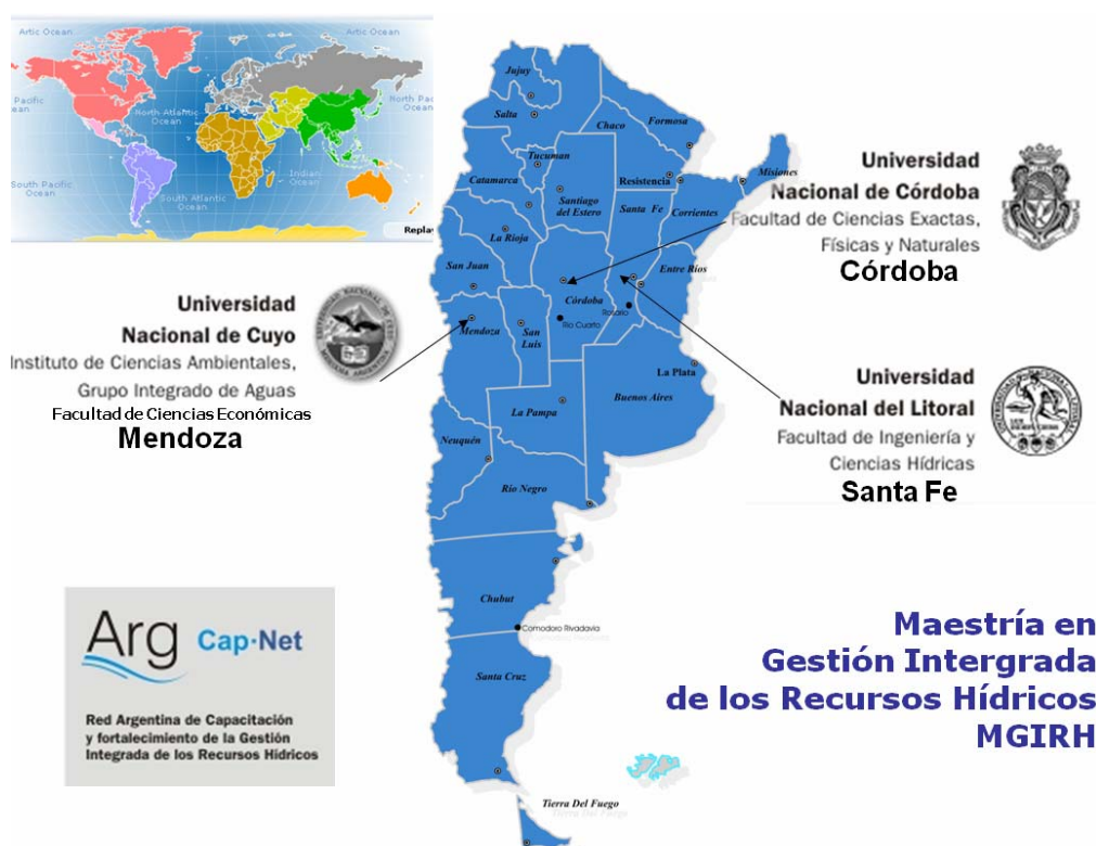
Figura 1: Ubicación geográfica de las Universidades Sedes de la MGIRH

Se trata de una carrera de posgrado única en su tipo en habla hispana, que se dicta de manera compartida y colaborativa (Wright et al., 2001) entre tres Universidades Nacionales de Argentina: Universidad Nacional de Córdoba (UNC), Universidad Nacional de Cuyo (UNCu) y Universidad Nacional del Litoral (UNL) (Figura 1), que conforman una red de Instituciones de Educación Superior (Vaca Badillo, 2006). Estas casas de estudio e investigación mantienen una rica tradición de cooperación entre el sector académico, científico, gubernamental y privado, que se ha visto materializado en distintos proyectos y convenios conjuntos. La Figura 2 ilustra la estructura académica del posgrado, cuyas funciones, atribuciones y responsabilidades están perfectamente establecidas en el plan de estudio y reglamento de la carrera ( www.argcapnet.org.ar/mgirh ).