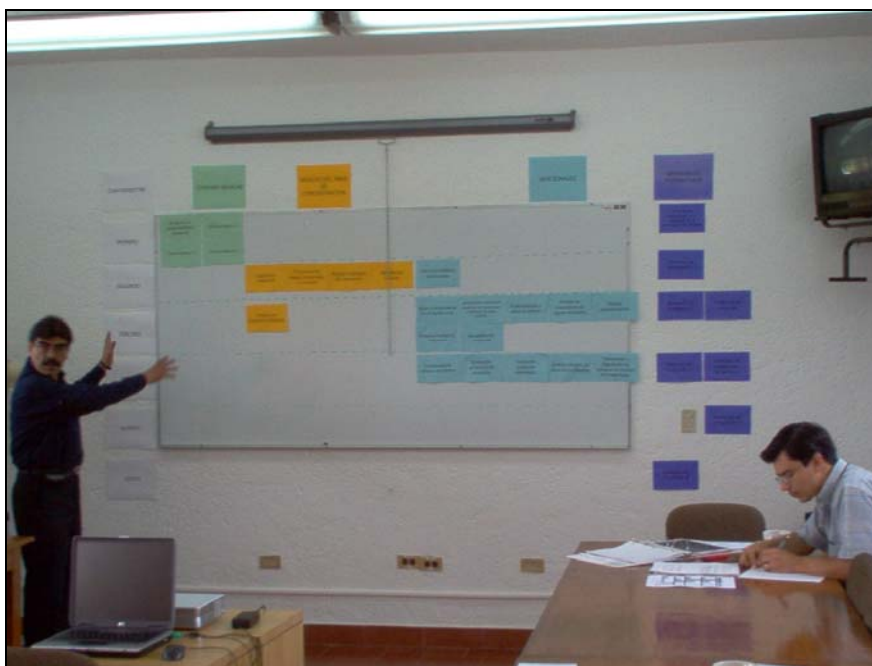
Foto 1: Reuniones con especialistas para el diseño curricular de la maestría

El diseño curricular que resultó de ese proceso se basa en una metodología participativa bajo la filosofía de “aprender haciendo” y un modelo curricular basado teóricamente en los planteamientos de Lawrence Stenhouse (currículum como proyecto de investigación) y de César Coll (currículum constructivista).