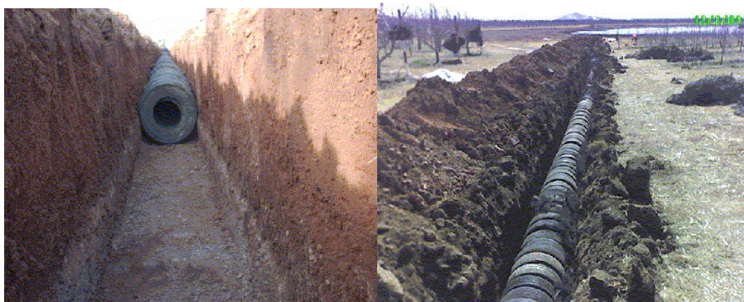
Figura 1. Drenaje agrícola con NFU.

En huerta las Macetas, de 253 has se implementó un sistema de drenaje agrícola con NFU con una extensión de 8.5 Km, distribuidos en una área de 75 has de plantación con manzanos, para lo cual se utilizaron 51 mil NFU. El riego es por microaspersión y es manejado de manera tradicional (Figura 1).