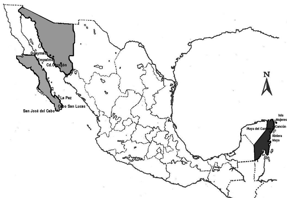
Figura 2. Estados y municipios de la Republica Mexicana muestreados.

Las alternativas propuestas fueron determinadas de acuerdo a las opciones del proceso de normalización determinado por la Dirección General de Normalización, y la selección de una de estas, se realizó basándose directamente en el objetivo de resolución a la problemática detectada. Para la evaluación de cada una de estas alternativas, se realizó una extensa revisión de las fuentes bibliográficas consultadas para el establecimiento