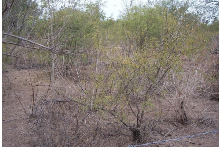
Figura 4.- Características físicas de los terrenos con potencial agrícola.

incorporar el área de interés a la producción agrícola bajo esta técnica. Parte de estas características se muestran en la Figura 4 .