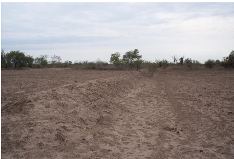
Figura 5.- Terreno con las bolsas listas para el almacenamiento del agua.

El manejo del agua en parcela presenta dos variantes detectadas; una de ellas consiste en que el productor mantenga el agua en el terreno durante dos días y después le abre una compuerta en la parte más baja del terrenos para desaguar y lograr mayor uniformidad al momento en que de punto el suelo; claro está, ello depende del conocimiento que tiene el productor de su terreno; es decir, si juzga conveniente el desagüe en función de la capacidad de retención de humedad que presente dicho predio; ya que esto le permitirá con cierta seguridad llegar con esa humedad residual hasta la cosecha del cultivo que establezca.