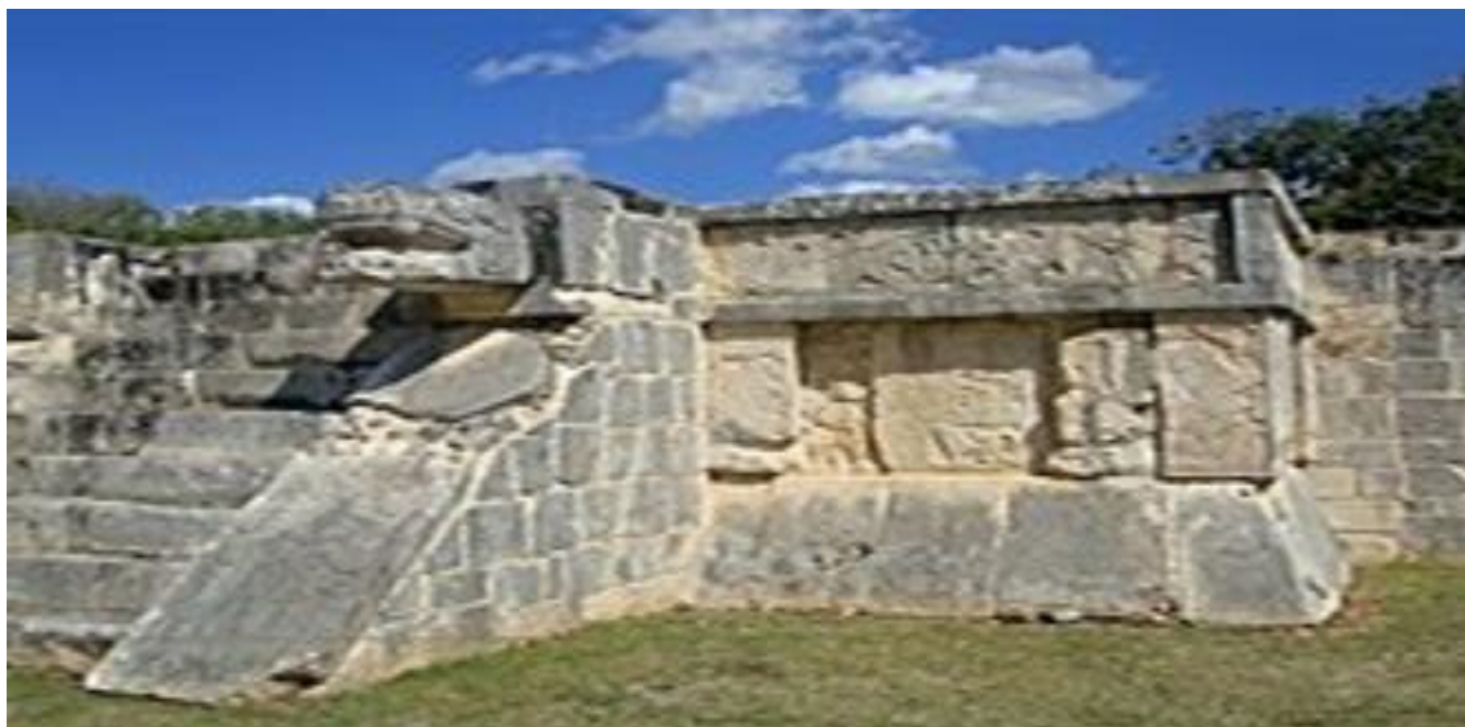
FOTO DEL TEMPLO DEL JAGUAR

El Templo del Jaguar en Chichén Itzá fue construido entre los años 1000 y 1150. Toma su nombre de una secuencia de jaguares ubicada en la parte frontal de la estructura, consta de diferentes capas que están intrincadamente esculpidas y muestran diferentes tipos de imágenes. Dos gigantescas serpientes emplumadas formaban las columnas en el vestíbulo de entrada, mientras que las paredes interiores estaban ricamente decoradas en piedra.