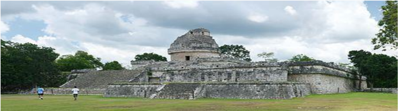
FOTO Y TEXTO DEL OBSERVATORIO EN CHICHÉN ITZÁ.

El Observatorio de Chichén Itzá, también conocido como el Caracol, es una estructura redonda muy similar a las que existen en otras partes de Mesoamérica.