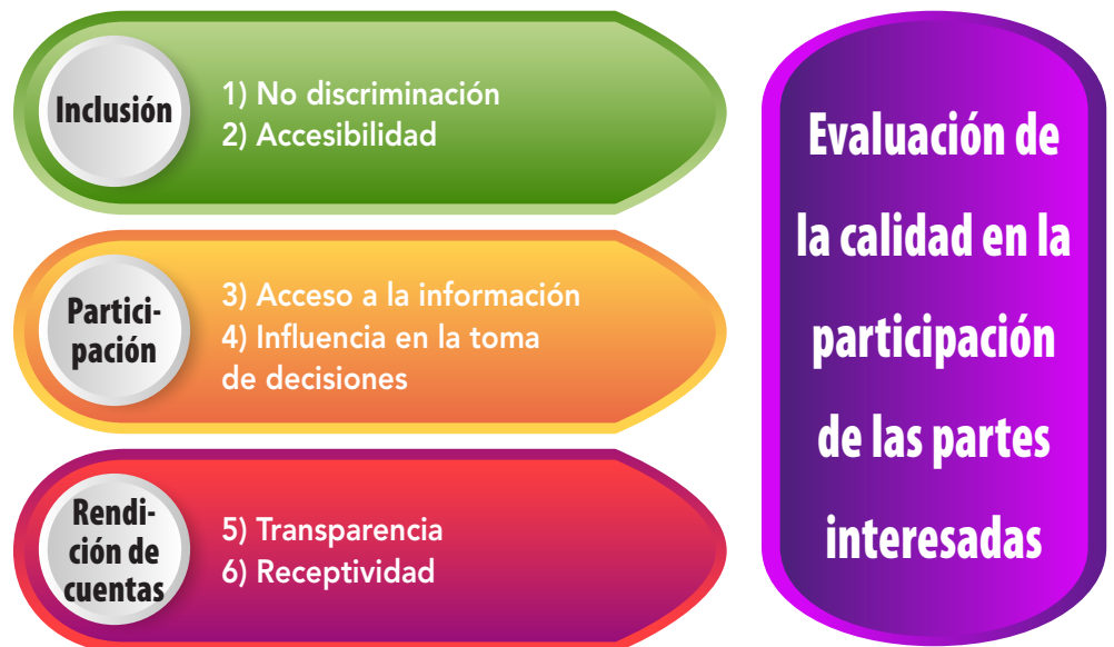
Diagrama 1: Principios y dimensiones del marco de análisis

En cada una de las dimensiones incluidas en el marco existen cuatro niveles , dentro de un continuo, para representar un aumento en la calidad de la participación de los actores interesados. El primer nivel (0) indica que se despliegan escasos esfuerzos respecto de la calidad en la participación de los actores. Los niveles subsiguientes (1-2) muestran un aumento en el empeño hasta alcanzar el nivel máximo (3), en el que se incluye un conjunto de criterios que demuestran una participación incluyente y colaborativa de los actores. Estos niveles se han estructurado de forma deliberada para que se excluyan mutuamente, con vistas a facilitar el análisis de las prácticas de participación de forma sencilla, aunque sólida . A continuación se ofrece una lista con las definiciones clave de los principios y aspectos que se recogen en el marco.