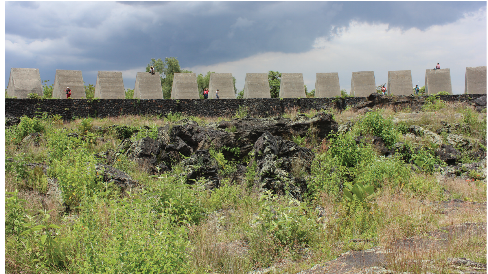
Espacio escultórico en Ciudad Universitaria, Fotografía: Rebeca Solís, 2016

La definición primordial de la ciudad esponja es el uso eficiente del agua, en especial el manejo de las aguas pluviales bajo condiciones extremas, como los aguaceros que hacen colapsar el sistema de canalización. Cuando se desbordan las aguas de las coladeras e inundan los terrenos, cuando las calles se convierten en canales –en una evocación, en la Ciudad de México, de la memoria de Tenochtitlan, la ciudad lacustre–, se activa una alerta ambiental. Inspirado por estos escenarios que se repiten cíclicamente en muchas urbes del mundo, ingenieros ambientales y arquitectos paisajistas (como