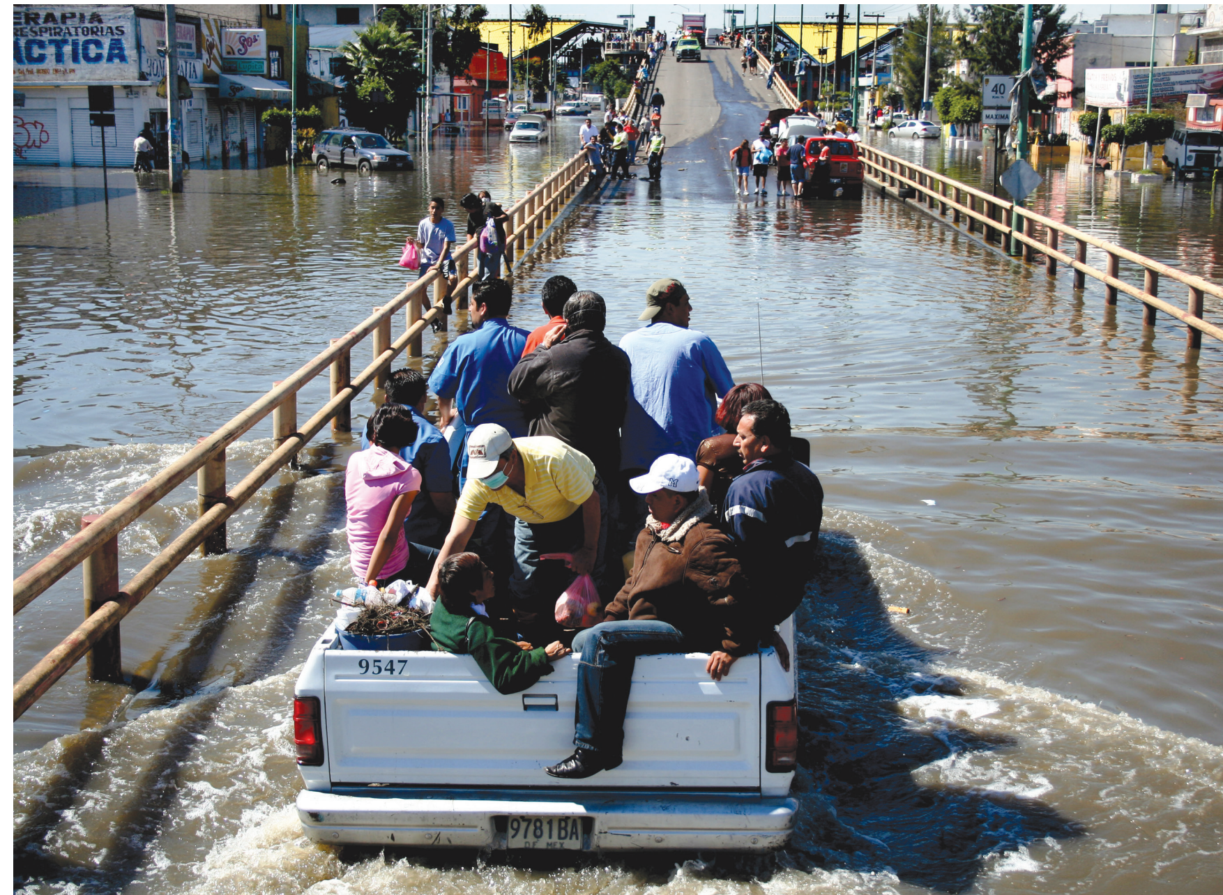
Inundación en la Ciudad de México, febrero de 2010. Fotografía: Germán Espinosa

Tal visión choca con una realidad aplastante donde la especulación inmobiliaria, con su “insensatez del cortoplacismo,” 25 agrava la crisis ambiental-urbana. No obstante, la pandemia del SARS-CoV-2 del histórico 2020 exige reflexiones profundas, provocativas y productivas sobre el futuro del planeta hiperurbanizado. En estos debates se inserta la utopía concreta de la ciudad esponja. He aquí un estímulo que considerar para un nuevo contrato socio-urbano, a favor del espacio libre y de libertad. Hay que recordar que una de las funciones de la planeación urbana es tanto la mediación entre las diferencias sociales como entre la civilización y la naturaleza. Éstas son las dos esferas de acción: otorgar un concepto espacial más digno a las masas de pobres acumuladas en las infinitas colonias populares y reinsertar elementos naturales en las densas estructuras urbanas.