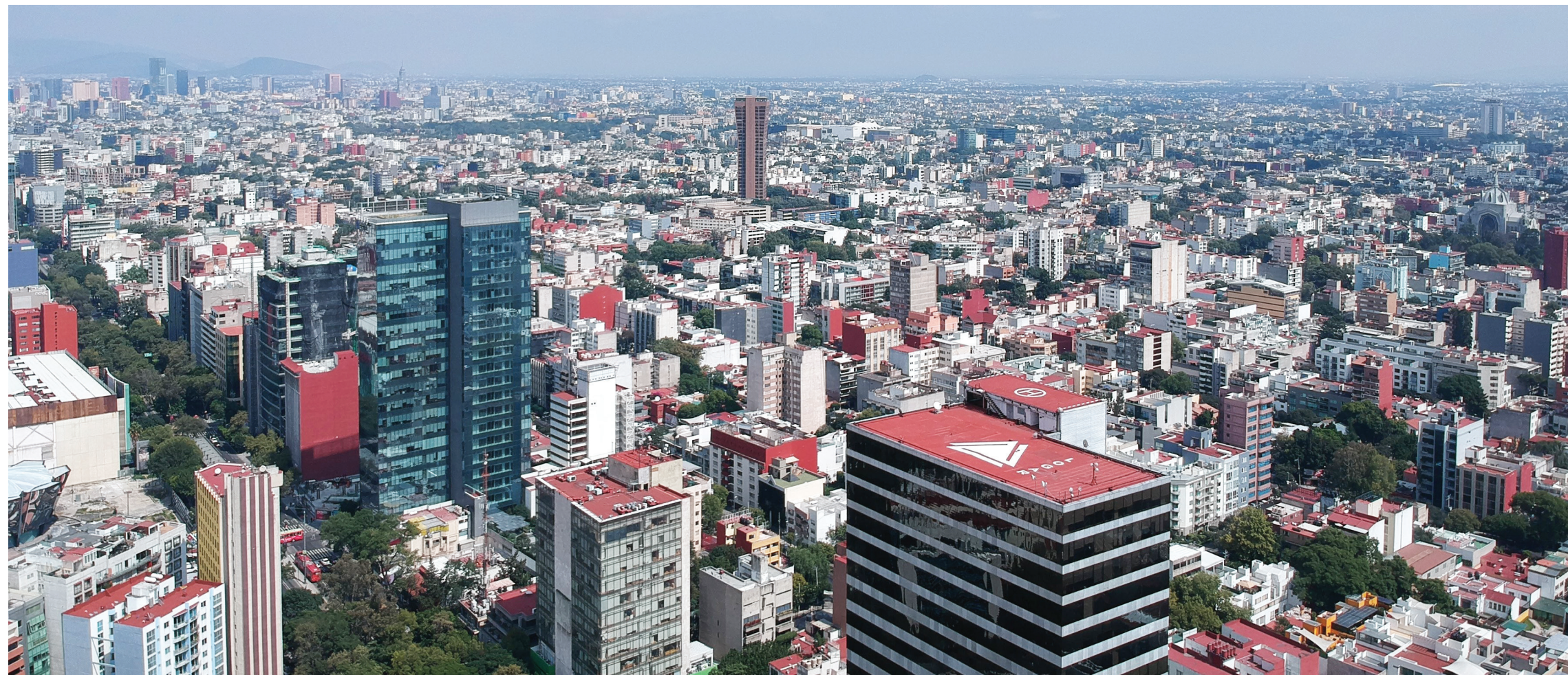
Fotografía aérea de la Ciudad de México, 2019.

En contraste con los vastos territorios sellados de la megalópolis, cu dispone de un amplio espacio compensatorio –como ya mencioné–, aunque el pasto de su explanada central definitivamente no cumple con los estándares ambientales requeridos de la ciudad esponja, porque es una vegetación exógena que absorbe mucha agua. Basta ver el drama ecológico cotidiano de los jardineros de cu que desperdician enormes cantidades de agua por medio de las redes de aspersores –por lo demás, mal ubicados, pues más bien mojan el asfalto. A pesar de este déficit, cu es un fractal importante de la ciudad esponja. Cabe mencionar que el equipo de la propia REPSA, en colaboración con la Facultad de Arquitectura, desarrolló el contra-modelo sustentable de “xero-jardinería,” que espera su aplicación sistemática y completa en todas las zonas de cu. 7