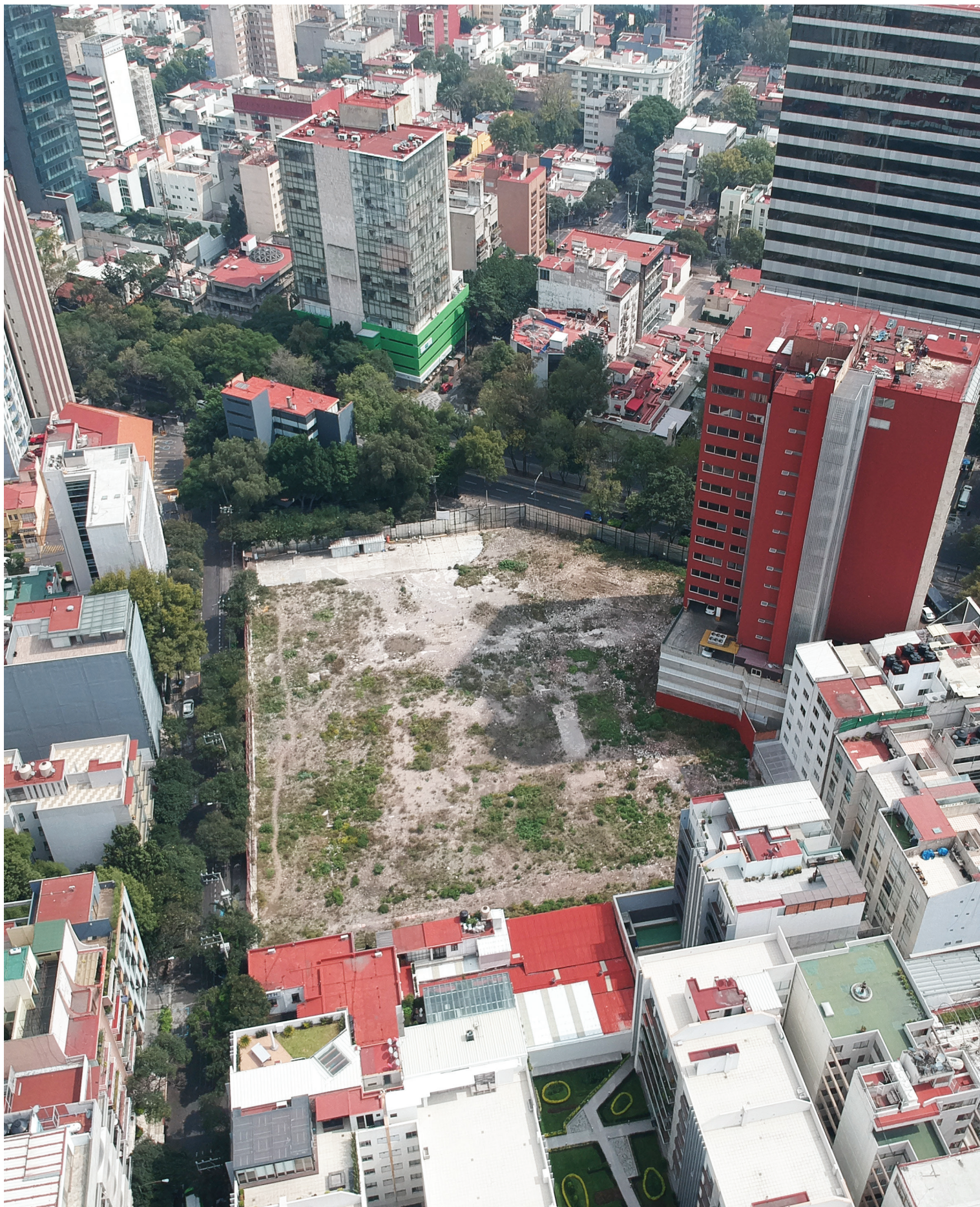
Terreno baldío en la colonia Nápoles de la Ciudad de México, 2019.

Este espacio sería un escenario para la reorganización pospandémica de un fragmento de la megaurbe que proporcione un espacio educativo para el reconocimiento de la biodiversidad, un lugar para experimentar la nueva relación entre ciudad y naturaleza, un paradigma para una ética ambiental que no se agota en la repetición de fórmulas vacías como la de sustentabilidad. Por razones económicas, 26 tal “espongiología urbana” –empleada en la REPSA y presente también en CU durante la contingencia– es irrealizable en un lugar como la colonia Nápoles, pero vale la pena reanimar una noción del filósofo Ernst Bloch: pensar es rebasar, superar una realidad abrumadora. La grave crisis suscitada por la reciente pandemia abre un espacio de reflexión sobre las rutinas autodestructivas en el desarrollo de ciudades y paisajes y respecto a nuestras responsabilidades en tiempos del Antropoceno.