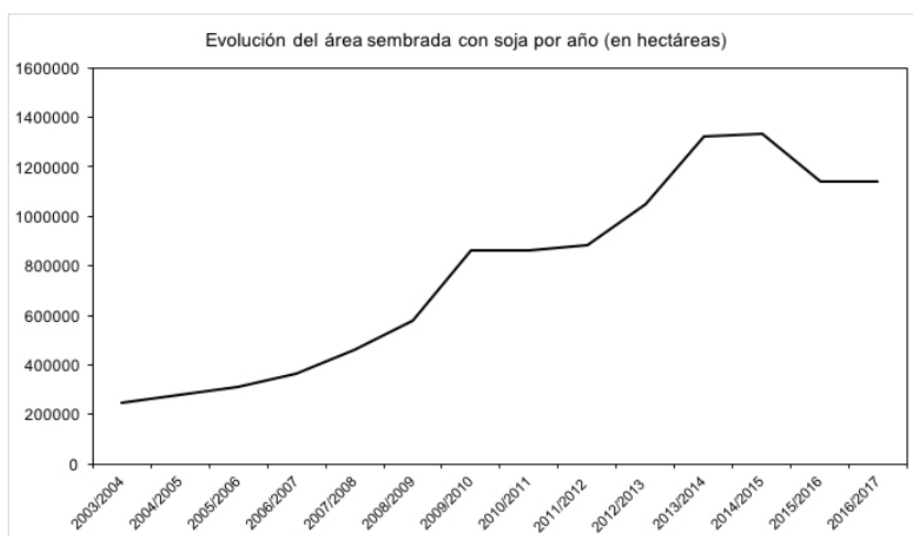
FIGURA 1. SUPERFICIE DEDICADA AL CULTIVO DE SOJA EN URUGUAY. 2003-2016.

Fuente: Datos obtenidos del Ministerio de Ganadería, Agricultura y Pesca (MGAP).